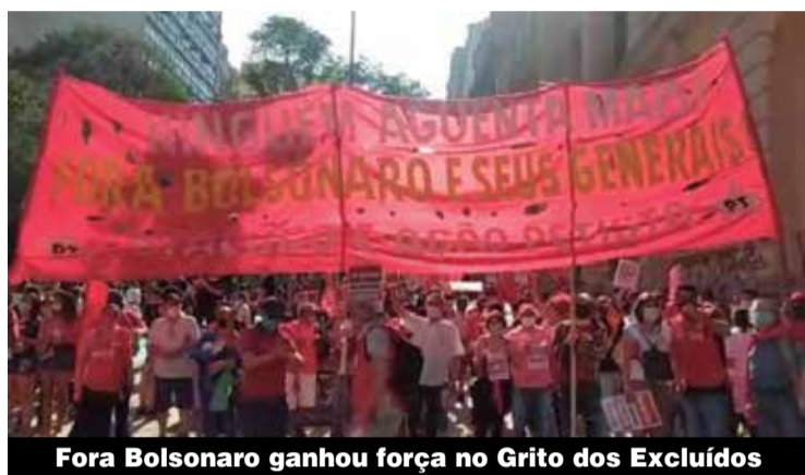
Fora Bolsonaro ganhou força no Grito dos Excluídos

Os atos são organizados pelas Frentes Brasil Popular e Povo Sem Medo, e pelas centrais sindicais. Na semana passada, nove partidos (PT, PSOL, PCdoB, PDT, PSB, PV, Rede, Cidadania e Solidariedade) anunciaram que vão participar dos atos, que chamaram de “essencial na estratégia unificadora”.