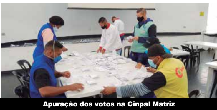
Apuração dos votos na Cinpal Matriz