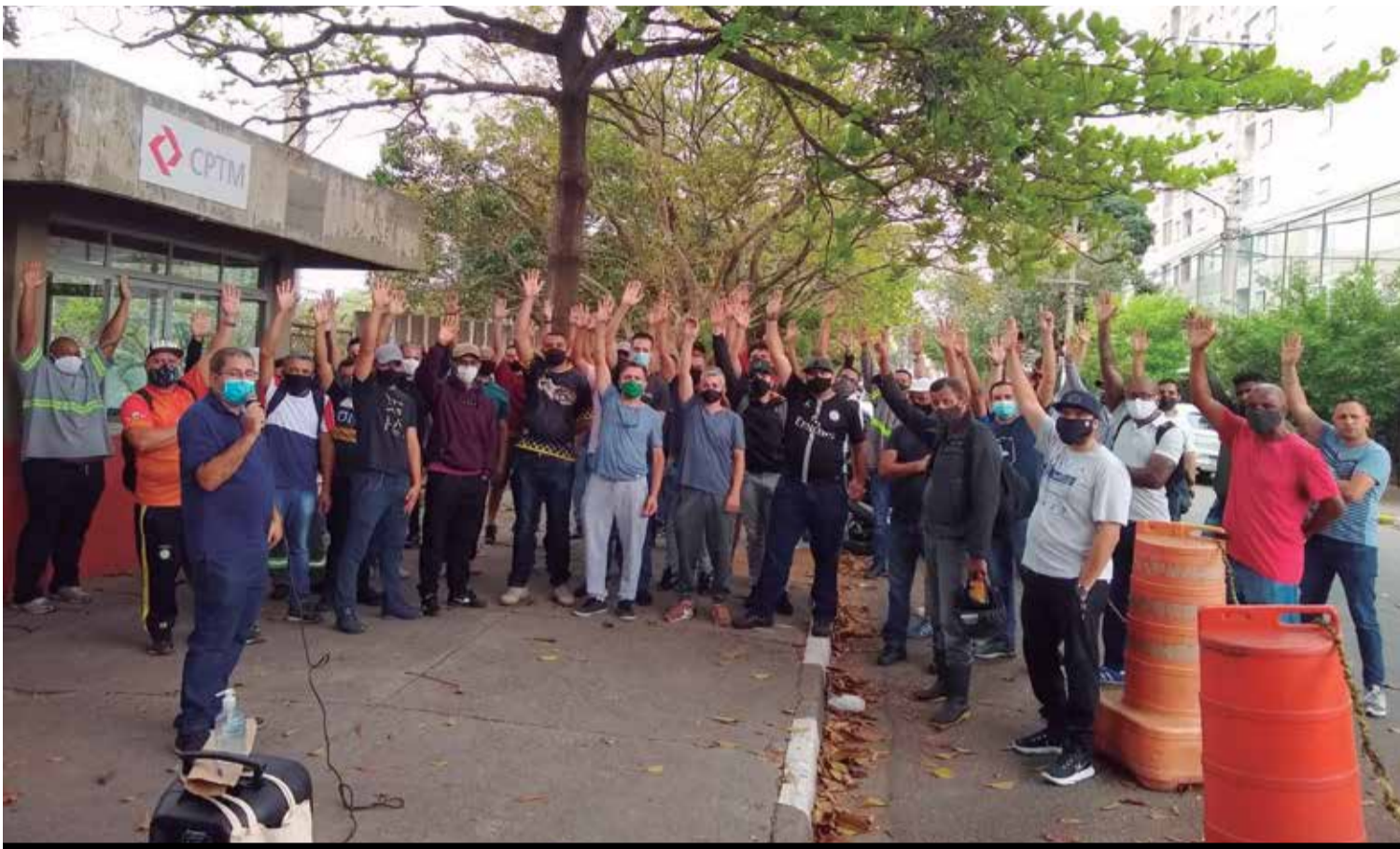
Companheiros da Hyundai Rotem mantiveram a mobilização firme até conquistar abono de R$ 4.500