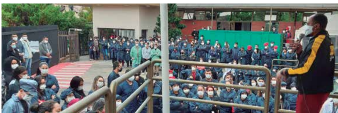
Companheiros da Tec Toy mobilizados para Campanha Salarial

real, manutenção dos direitos da Convenção Coletiva e manutenção e ampliação de benefícios. No sábado, 25, também começa os seminários regionais da Campanha Salarial que será mais um espaço de mobilização e construção de estratégia de luta. P.3