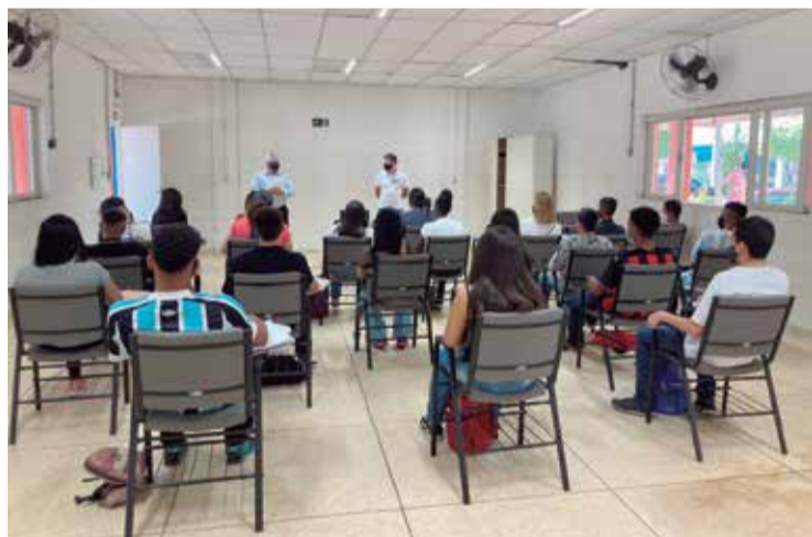
Aulas serão ministradas pelo Senai no Metalclube