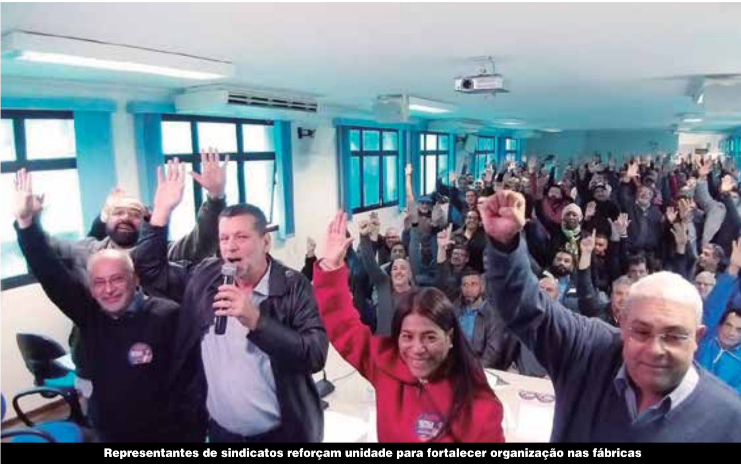
Representantes de sindicatos reforçam unidade para fortalecer organização nas fábricas