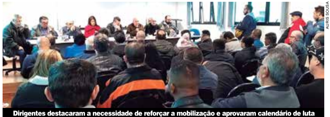
Dirigentes destacaram a necessidade de reforçar a mobilização e aprovaram calendário de luta

Agora é oficial. Na terça-feira, 30, a categoria deu pontapé inicial na Campanha Salarial unificada deste ano, em plenária realizada na Federação dos Metalúrgicos do Estado de São Paulo. A diretoria do Sindicato e representantes dos demais 53 sindicatos filiados à Federação participaram do encontro.