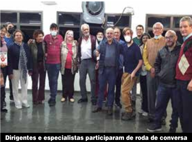
Dirigentes e especialistas participaram de roda de conversa