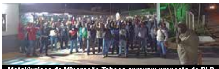
Metalúrgicos da Mineração Taboca aprovam proposta de PLR

O pagamento da primeira parcela aconteceu na terça, 30. Além da PLR, o administrativo da unidade de Pirapora do Bom Jesus também aprovou a troca de feriado. E os companheiros de Alphaville aprovaram compensação de dias pontes.