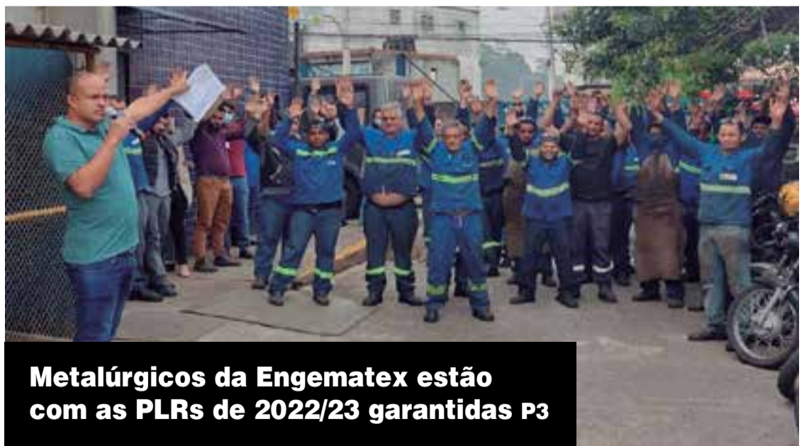
Metalúrgicos da Engematex estão com as PLRs de 2022/23 garantidas P3

Setembro, mês de prevenção do suicídio P.4