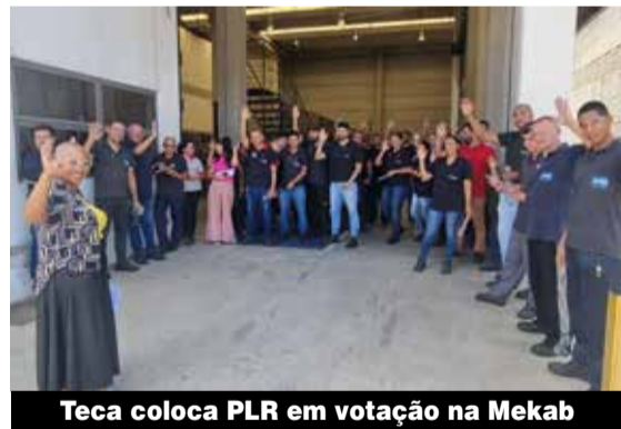
Teca coloca PLR em votação na Mekab