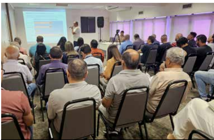
Dados foram apresentados na sede do Sindicato