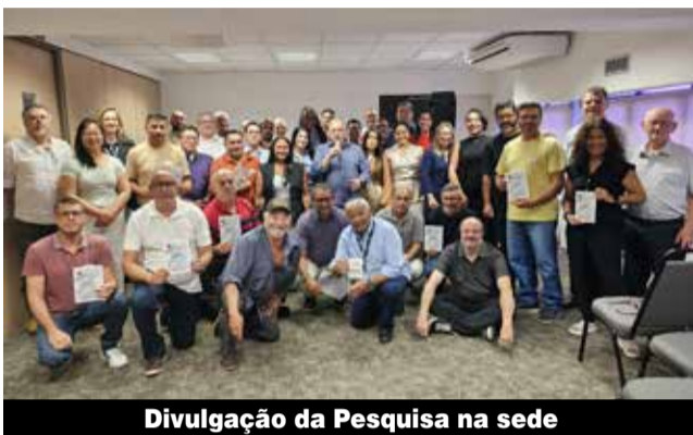
Divulgação da Pesquisa na sede