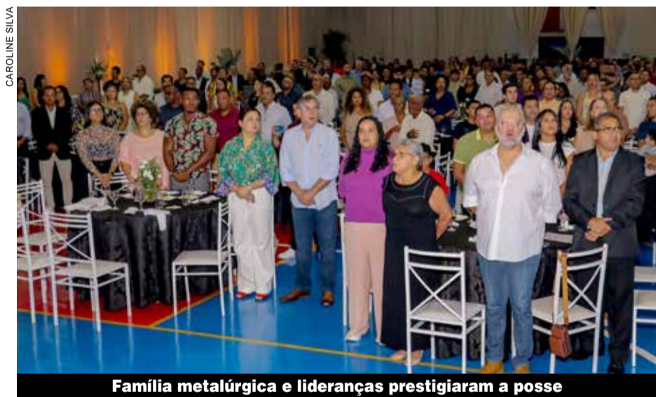
Família metalúrgica e lideranças prestigiaram a posse