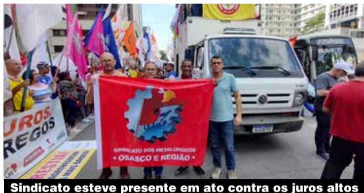
Sindicato esteve presente em ato contra os juros altos

graduais, chegando a 10% para rendimentos anuais superiores a R$ 1,2 milhão. Para entrar em vigor, o texto precisa ser aprovado no Congresso. [Com Agências de Notícias]