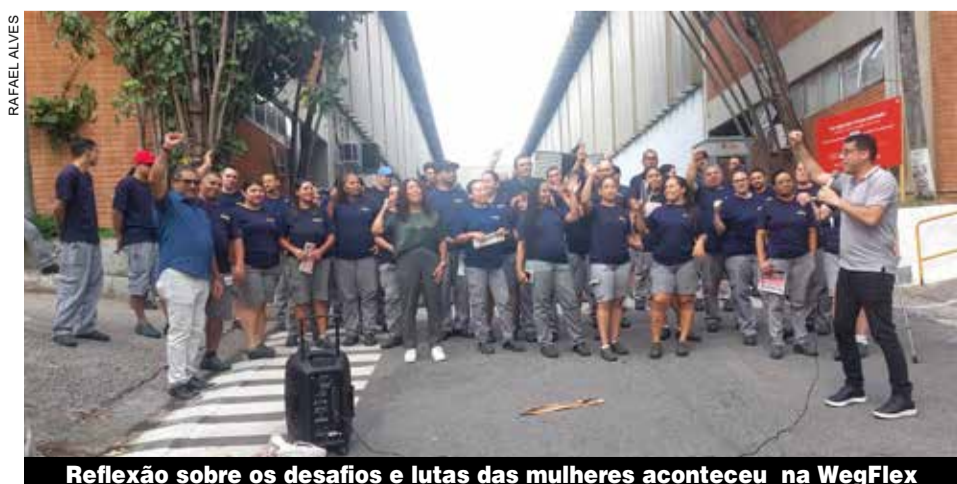
Reflexão sobre os desafios e lutas das mulheres aconteceu na WegFlex

Acompanhe mais informações sobre o 8 de Março no www.sindmetal.org.br .