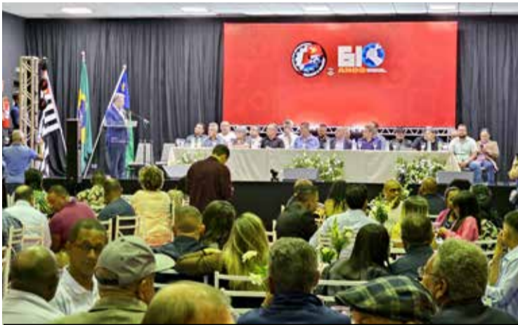
Família metalúrgica e lideranças presentes na posse