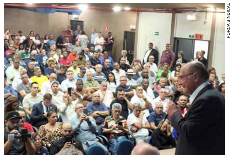
NIB (Nova Indústria Brasil) foi destaque

Pesquisa mostra que 97,7% das vagas destinadas para Lei de Cotas estavam preenchidas nas metalúrgicas de Osasco e região. Os dados foram apresentados na quinta-feira, 20, na sede do Sindicato. P.4