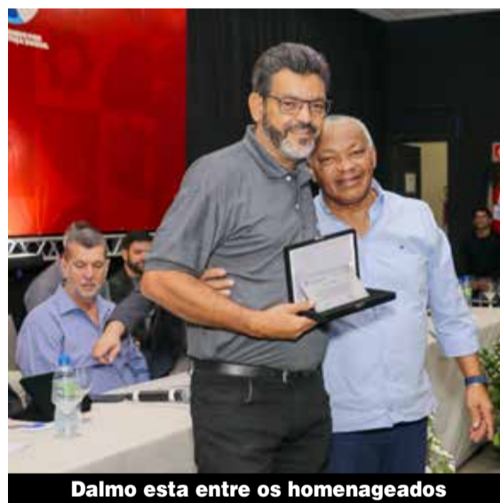
Dalmo esta entre os homenageados