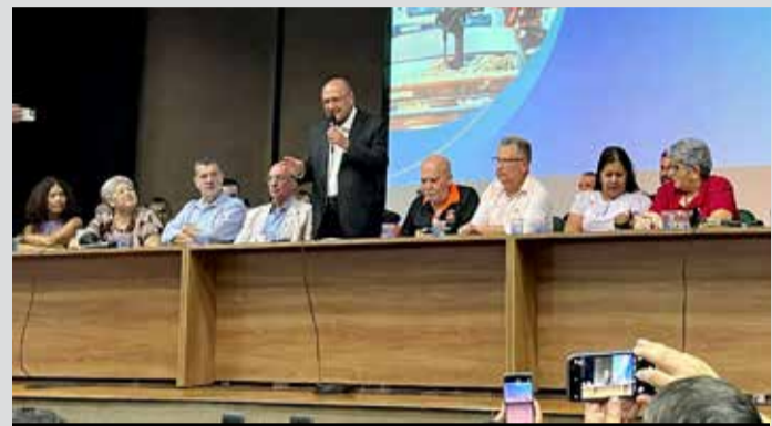
Alckmin: "é preciso recolocar a indústria no centro"

Em encontro na Força Sindical, o vice-presidente e ministro do Desenvolvimento, Indústria, Comércio e Serviços, Geraldo Alckmin, destacou na sexta-feira, 21, a necessidade de fortalecer a indústria no Brasil. Para isso, o governo conta com a NIB (Nova Indústria Brasil), que foi o assunto principal da conversa com dirigentes sindicais. O Sindicato participou da atividade.