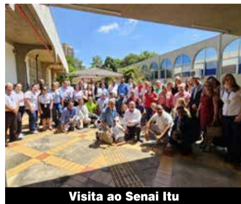
Visita ao Senai Itu