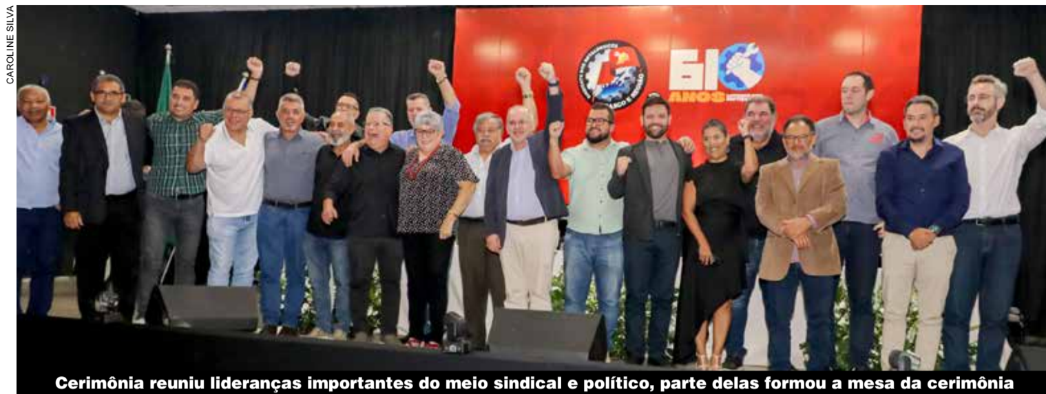
Cerimônia reuniu lideranças importantes do meio sindical e político, parte delas formou a mesa da cerimônia

A nova diretoria do Sindicato tomou posse em uma prestigiada cerimônia realizada na quinta-feira, 20, no Ginásio do Metalclub. Os novos dirigentes assumiram o compromisso de representar e defender os interesses dos metalúrgicos de Osasco e região pelos próximos quatro anos (2025-2029).