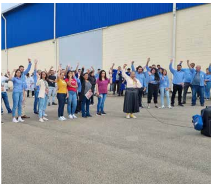
Assembleia na Protec destacou direitos das mulheres

Ao longo do mês, a diretoria tem reforçado nas portas das fábricas as pautas de interesse das mulheres, como a Lei da igualdade salarial, combate à violência, política de cuidados, mulheres em cargos de lideranças, creches, entre outros. P.3