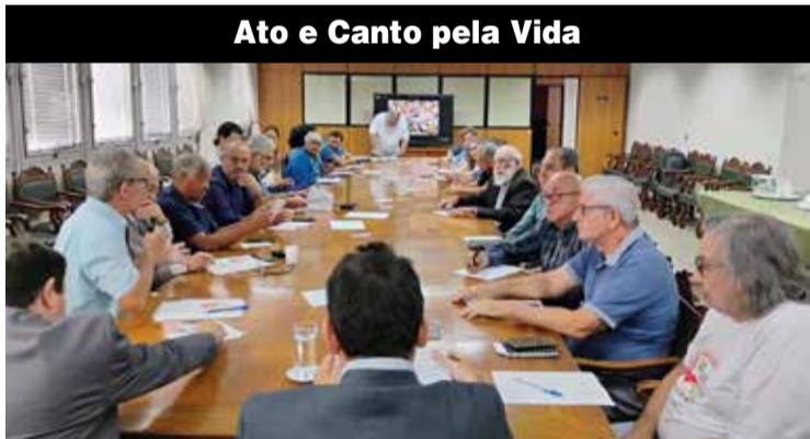
Ato e Canto pela Vida

Aconteceu na sexta-feira, 21, a primeira reunião preparatória para o Ato e Canto pela Vida, em Memória das vítimas de acidentes e doenças relacionadas ao trabalho. O encontro reuniu representantes de sindicatos, centrais sindicais, Centros de Referência em Saúde do Trabalhador, Ministério do Trabalho e Emprego e Fundacentro e jornalistas na SRTE-SP (Superintendência Regional do Trabalho e Emprego de São Paulo).