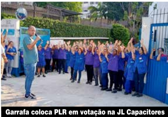
Garrafa coloca PLR em votação na JL Capacitores