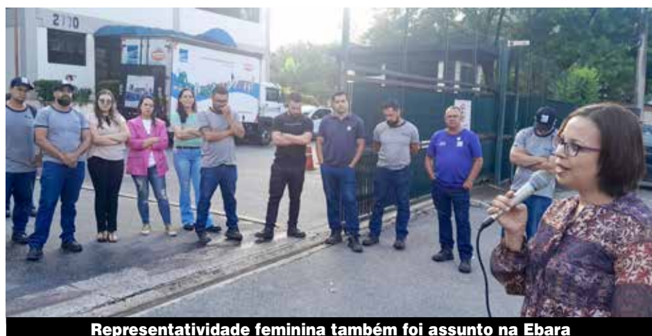
Representatividade feminina também foi assunto na Ebara