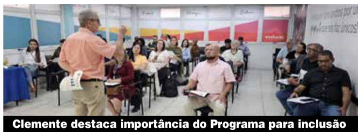
Clemente destaca importância do Programa para inclusão

“Houve um ligeiro crescimento mês a mês. Para parte das empresas, está havendo um trabalho de orientação feito pelo Sindicato. Para outras, está ocorrendo uma ação fiscal. Ao final do Programa, vamos avaliar o que de fato ocorreu na região”, disse