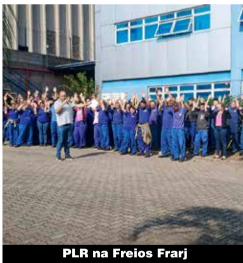
PLR na Freios Farj