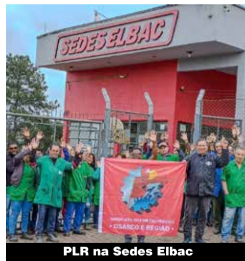
PLR na Sedes Elbac